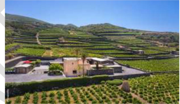
IMMAGINE G (destra): la tenuta di donna fugata

La location è scelta per il convegno della seconda giornata del Festival. La cantina dispone di servizi e area parcheggio per circa 20 auto.