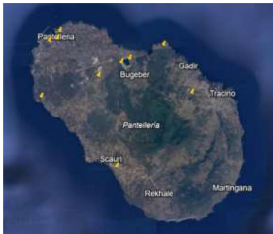
IMMAGINE A: I luoghi e le location scelte per gli eventi sono sparsi su tutto il territorio. Tra le varie location abbiamo scelto il faro di Punta Spadillo, il Cineteatro, piazzetta Messina, I Sesi, il Lago di Venere, la Cantina di Donnafugata, l'azienda agricola Saperi di Pantelleria come luoghi ospitanti per le varie attività.

Nelle prossime pagine saranno dettagliate le location individuate